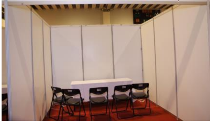
競賽區場地參考圖示